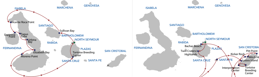
Crucero 5 días "C" Sábado - Miércoles