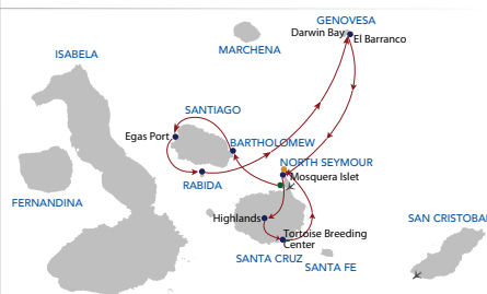
Crucero 5 días "A" Martes - Sábado