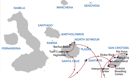
Crucero 7 días "D" Miércoles - Martes

● Arribo ● Punto de Visita ● Salida ✈️ Aeropuerto