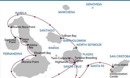
Crucero 8 días "B" Sábado - Sábado