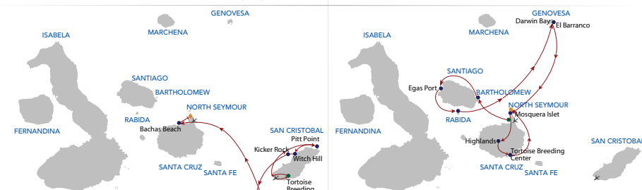
Crucero 4 días "A" Sábado - Martes