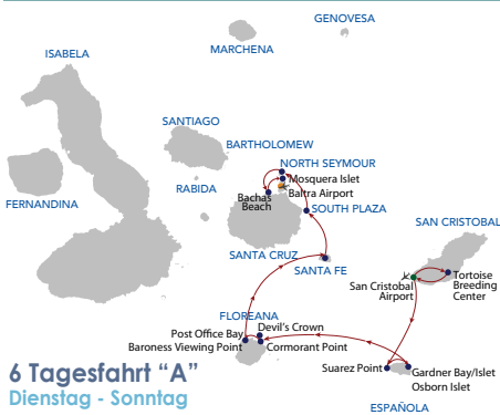
6 Tagesfahrt "A" Dienstag - Sonntag