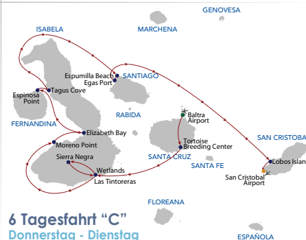
6 Tagesfahrt "C" Donnerstag - Dienstag